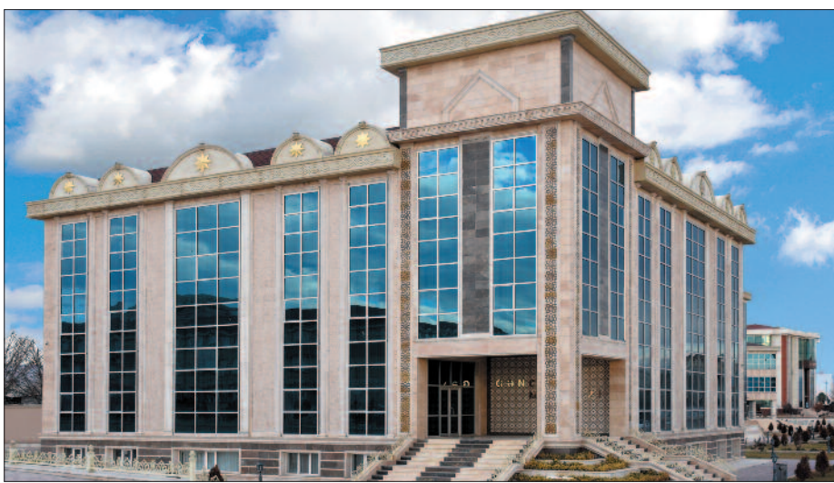
1997-ci il fevralın 1-də ulu öndər Heydər Əliyevin Sərəncamı ilə Gənclərin Birinci Forumunun keçirildiyi gün – fevralın 2-si Azərbaycanda Gənclər Günü elan edilmişdir.

Naxçıvan Muxtar Respublikası Ali Məclisinin mətbuat xidməti